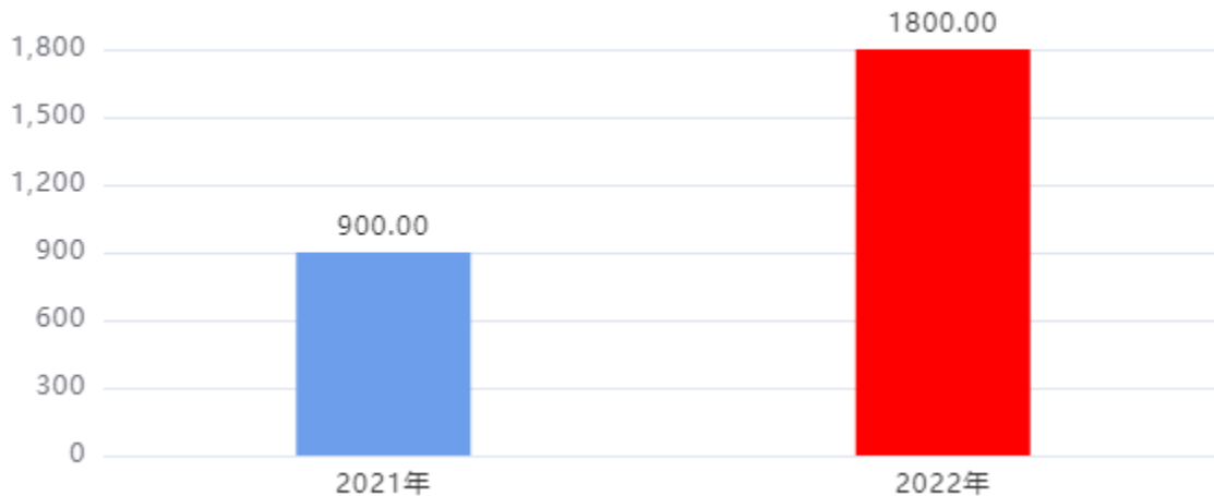
财政拨款收、支决算总计变动情况图（单位：万元）

2022年度财政拨款收、支总计1,800.00万元。与2021年度相比，财政拨款收、支总计各增加900.00万元，增长100.00%。主要是改善办学条件资金-职业教育发展资金增加。