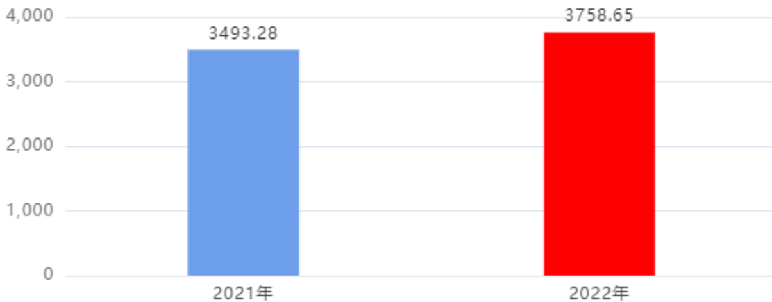
收、支决算总计变动情况图（单位：万元）

2022年度收、支总计3,758.65万元。与2021年度相比，收、支总计各增加265.37万元，增长7.60%。主要是改善办学条件资金-职业教育发展资金增加，人员经费相应增加。