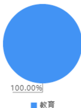
一般公共预算财政拨款支出决算结构图

2022年度一般公共预算财政拨款支出1,800.00万元，主要用于以下方面：教育（类）支出1,800.00万元，占100.00%。